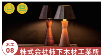
木工 08 株式会社柿下木材工業所

古家具を新しい形へリメイク、 家具の修理も行います。 【制作者来場】土日のみ(予定) tel.090-9394-5947