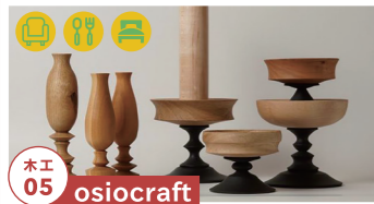
木工 05 osiocraft

森と木と暮らしをつなぐことをしています 10/29-30のみ【制作者来場】10/29-30 tel.0577-77-9773