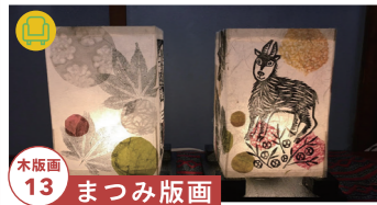
木版画 13 まつみ版画

信州木曾谷にある上松町での『暮らす』を考え、 まるで『実験室』のように実践しています。 【制作者来場】10/22-30 tel.090-9666-6316