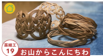
藁細工 19 お山からこんにちわ

藁の魅力伝える3人組。 藁細工の展示販売 【制作者来場】10/29 tel.080-1952-1942