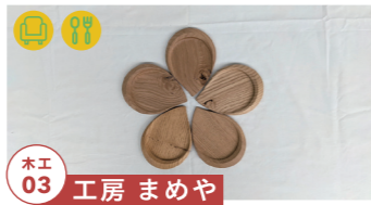
木工 03 工房 まめや

「ずっと触れていなくなる家具」を テーマに制作しています tel.090-5612-4148