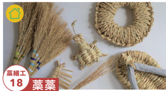
藁細工 18 藁藁

仏像をはじめとした木彫り作品を 制作しています。 tel.0577-55-3805