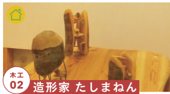
木工 02 造形家 たしまねん