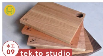
木工 09 tek.to studio

天然無垢材を使用した木製照明の インスタレーション展を開催 tel.0577-32-2269