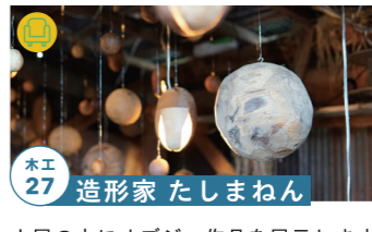
木工 27 造形家 たしまねん

ショールームに家具とクラフト品展示 Instagram(@arts.craft.japan)にて最新情報配信! 高山市朝日町上ヶ見 40-1 10/22-23 10/29-30 tel.0577-55-3005