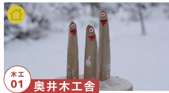
木工 01 奥井木工舎