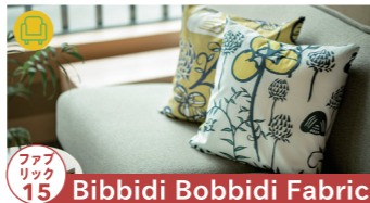
フブリック 15 Bibbidi Bobbidi Fabric

こだわるカップをテーマに製作 【制作者来場】10/23 tel.0577-35-3339