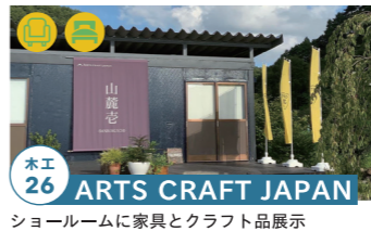
木工 26 ARTS CRAFT JAPAN

飛騨の匠の技が光る話題の農泊施設 10/22-23・29-30 はイベント開催! 高山市朝日町甲 986 tel.0577-37-4813