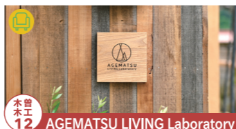
木工 12 AGEMATSU LIVING Laboratory

家具、生活雑貨のほか、ねこ(木曾の伝統的な 防寒着で袖なしの半纏)の展示販売もあり。 【制作者来場】10/22-23 tel.090-5721-8837