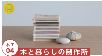
木工 04 木と暮らしの制作所

「ずっと触れていなくなる家具」を テーマに制作しています tel.090-5612-4148