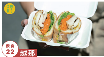
飲食 22 越那

特製サンドイッチの販売 10/23 10/29-30 tel.080-5291-1277