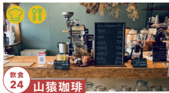
飲食 24 山猿珈琲

自家焙煎豆の販売をはじめ、 生豆販売、コーヒーアイテム販売 10/29-30 tel.070-8473-1294