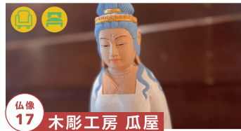
仏像 17 木彫工房 瓜屋

謎の生物「ムジナ」をモチーフとした 絵画の展示 tel.080-6914-1754