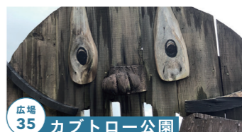
広場 35 カブトロー公園

ブランコなど手製の遊具で遊べる 高山市朝日町立岩 928 tel.0577-55-3678