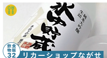
飲食 32 リカーショップながせ

川魚の剥製がある喫茶店 高山市朝日町小谷 189-3 平日10:00~15:00 土日10:00~17:00 定休日:月・火 tel.0577-55-3095