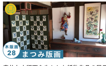
木版画 28 まつみ版画

小屋の中にオブジェ作品を展示します。 高山市朝日町甲 259 10/29-30 tel.090-1741-3099