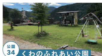
公園 34 くわのふれあい公園

移住者向けシェアハウスを運営 高山市朝日町立岩 1242 tel.0577-55-3208