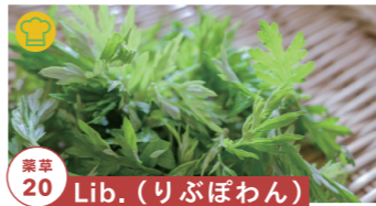
薬草 20 Lib.(りぶぼわん)

籐と胡桃のアクセサリーの展示販売 【制作者来場】10/29 ~15時まで tel.090-6572-8067