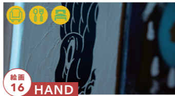
絵画 16 HAND

飛騨をモチーフにした日常に 魔法をかけるフブリック tel.0577-57-9150