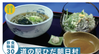
飲食 30 道の駅ひだ朝日村

元祖飛騨よもぎうどんをぜひ 高山市朝日町万石 150 売店9:00~17:00/レストラン10:00~15:00 定休日:水曜日 tel.0577-55-3777