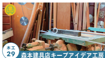
木工 29 森本建具店キープアイデア工房

素朴な木版画を生かした紙物作品の展示 高山市朝日町立岩 426 10/29-30 tel.090-7437-5677