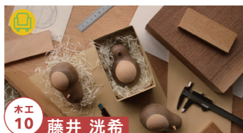
木工 10 藤井 洗希

子ども用椅子とローテーブルほか、 木製小物の展示販売 【制作者来場】10/22-23・29-30 tel.070-8317-8350