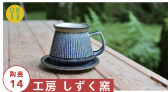
陶芸 14 工房 しずく窯

こだわるカップをテーマに製作 【制作者来場】10/23 tel.0577-35-3339