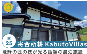
家 25 寄合所耕 KabutoVillas

自家焙煎豆の販売をはじめ、 生豆販売、コーヒーアイテム販売 10/29-30 tel.070-8473-1294