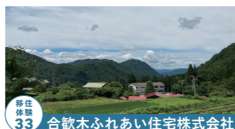
移住体験 33 合歓木ふれあい住宅株式会社

幻の酒「熊の涙」取扱店 高山市朝日町万石 779-1 6:00~21:00 定休日:毎月第2第4日曜日 tel.0577-55-3062