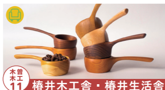
木工 11 椿井木工舎・椿井生活舎

木製小物や椅子を製作しています。 【制作者来場】10/29-30 tel.070-4062-7341