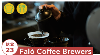
飲食 23 Falò Coffee Brewers

特製サンドイッチの販売 10/23 10/29-30 tel.080-5291-1277