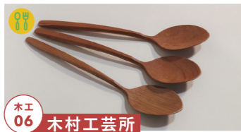
木工 06 木村工芸所

コンポート皿やキャンドルホルダーなど の木工旋盤を使った製品の展示 tel.080-4187-0927