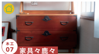
木工 07 家具々鹿々

古家具を新しい形へリメイク、 家具の修理も行います。 【制作者来場】土日のみ(予定) tel.090-9394-5947