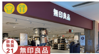
飲食 21 無印良品

飛騨の薬草製品を販売 10/30のみ【制作者来場】10/30 tel.070-4126-5256