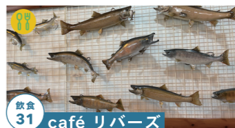
飲食 31 café リバース

元祖飛騨よもぎうどんをぜひ 高山市朝日町万石 150 売店9:00~17:00/レストラン10:00~15:00 定休日:水曜日 tel.0577-55-3777